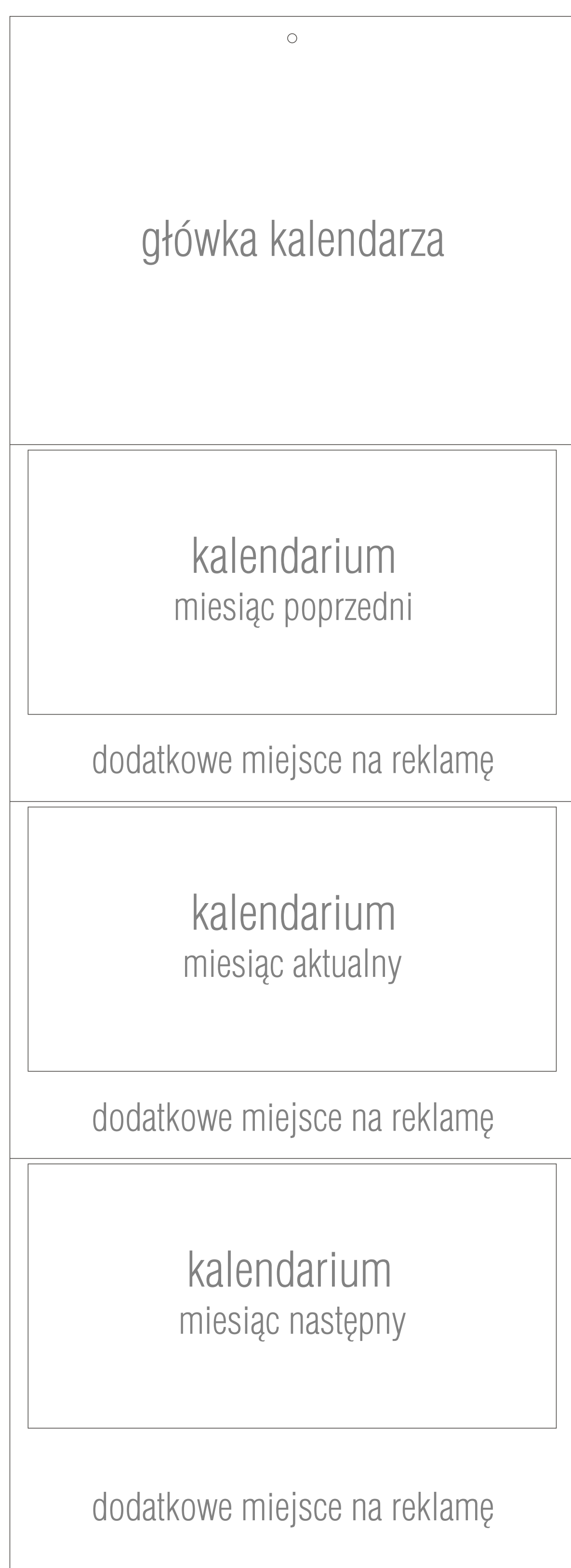
kalendarz skala 1:2